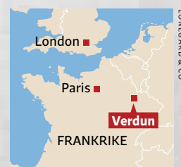
Verdun ligger i regionen Lorraine i nordöstra Frankrike.

D en lilla staden Verdun i nordöstra Frankrike med sina omkringliggande fort på dominerande höjder hade ett stort symboliskt värde 1916, vilket ur ett tyskt perspektiv gjorde den till ett bra →