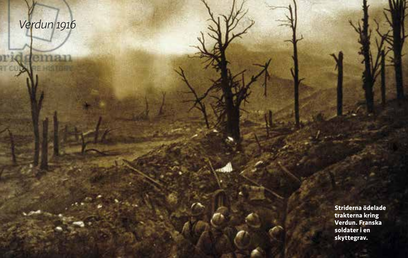
Striderna ödelade trakterna kring Verdun. Franska soldater i en skyttegrav.