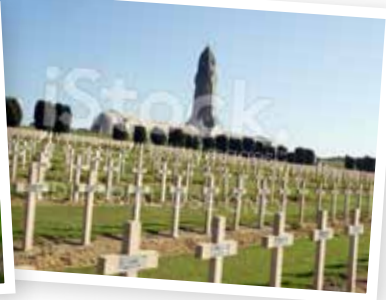
I landskapet syns fortfarande spåren efter striderna. Vid Douaumonts ossarium finns Frankrikes största krigskyrkogård från första världskriget.