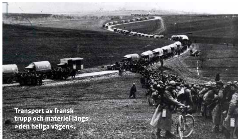
Transport av fransk trupp och materiel längs »den heliga vägen«.

I mars utvidgade Falkenhayn slaget genom att låta tyske kronprinsens (Wilhelm) armé anfälla på ömse sidor om floden Meuse. Den bayerske löjtnanten Adolf Ritter von Tutschek var kompanichef vid 40. infanteriregementet »Hohenzollern« som genomförde ett större