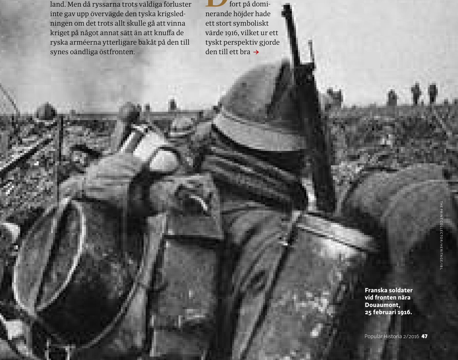
Franska soldater vid fronten nära Douaumont, 25 februari 1916.